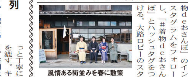
風情ある街並みを春に散策

22~4月6日 桜の名所で「着物deおさんぽ」和装での散策を呼び掛け 山口市の桜の名所である一の坂川周辺や、歴史的風情を感じさせる豎小路付近において、和装での散策を呼びかける催し「着物deおさんぽ」が、22日(土)から4月6日(日)まで開かれる。主催は山口市で、大路口ビル1の指定管理者・NPO