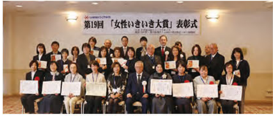
▲3月6日に行われた表彰式の様子