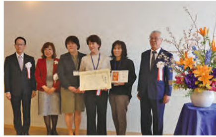
▲最優秀賞団体「グリーフサポートやまぐち」の皆さん

代表者が2000年に当時4歳の娘を飲酒運転事故により亡くし、当時は相談する処もなく、途方に暮れ、自身が困った経験から、交通事故被害者の相談等に関わり、01年に自助グループを立ち上げました。現在は、事故だけでなく病気・いじめ・自死等の相談や支援も行っています。